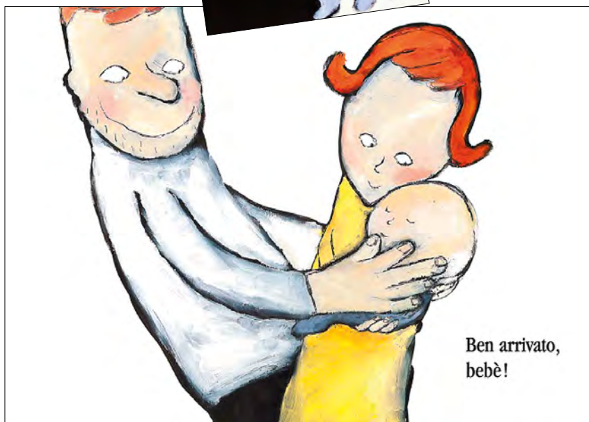
Copertina e illustrazione di Émile Jadoul da Le mani di papà (Babalibri, 2013)